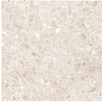
Marfil VC6001 ■ T095