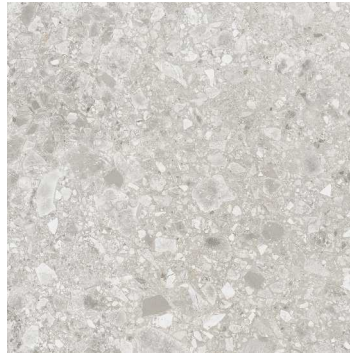
Gris VC6002 ■ T095